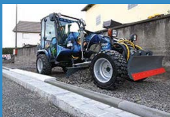
La niveleuse Stehr SUG 20 sur un chantier étroit