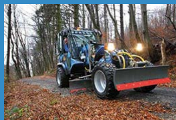
La niveleuse Stehr SUG 20 lors d'un nivellement de chemin de randonnée