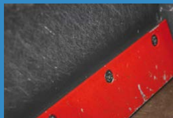
Plaque (Hardox® 450) avec coupe réglable et lame d'attaque interchangeable.