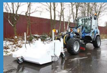
La balayeuse avec bac de ramassage vidable hydrauliquement