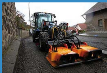
Le compacteur à plaques Stehr SBV 80 HC 2 sur un chantier urbain