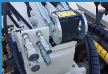
Accouplement rapide pour le raccordement hydraulique des équipements