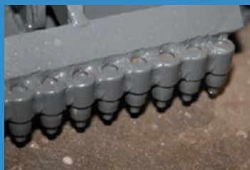
Les dents de déroctage arrondies pour la scarification de sols durs