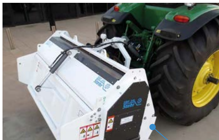
SBF 24 L