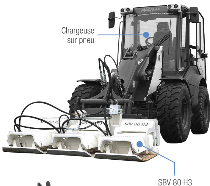
Chargeuse sur pneu

Stehr est reconnu dans le monde entier grâce aux solutions matériels qu'ils apportent aux opérateurs de construction, ils ont été pionniers du compactage embarqué sur porteurs et continuent encore à créer des matériels de grande qualité et à haute efficacité.